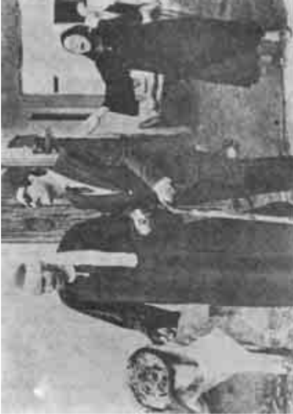
«مصر» فيلم «قاهر الظلام»