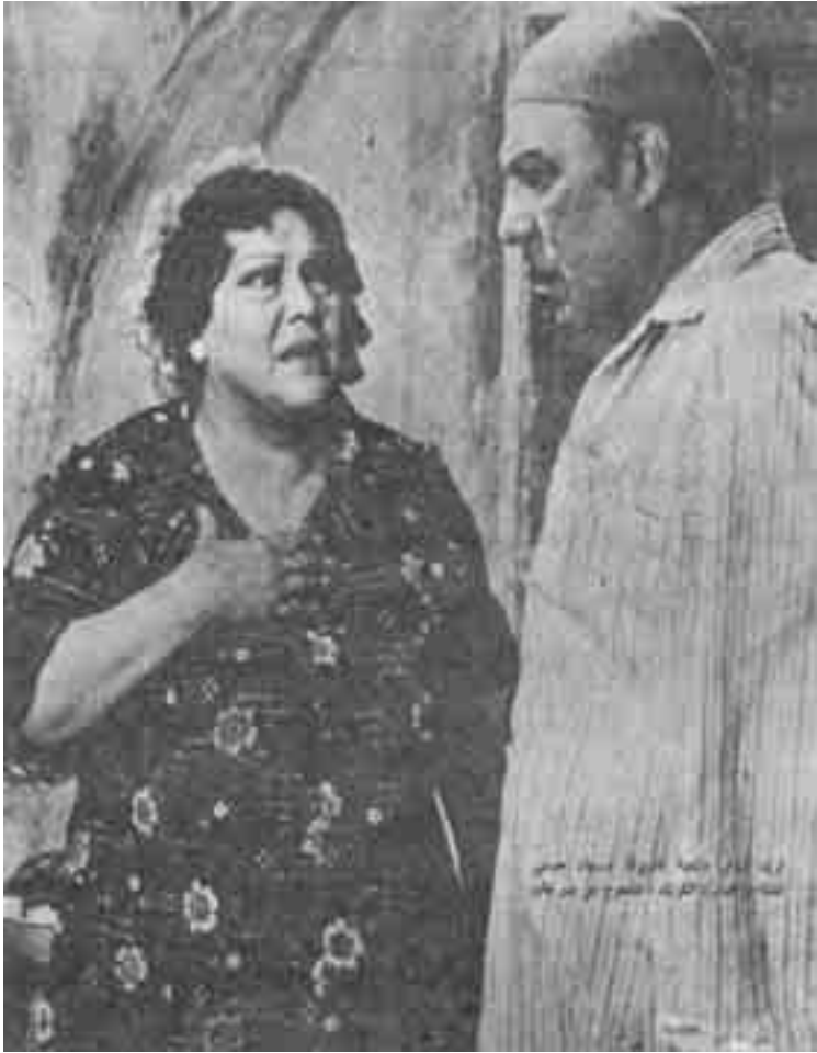
فيلم «الكرنك» مصر