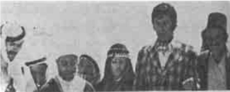
مشهد من فيلم «العار»