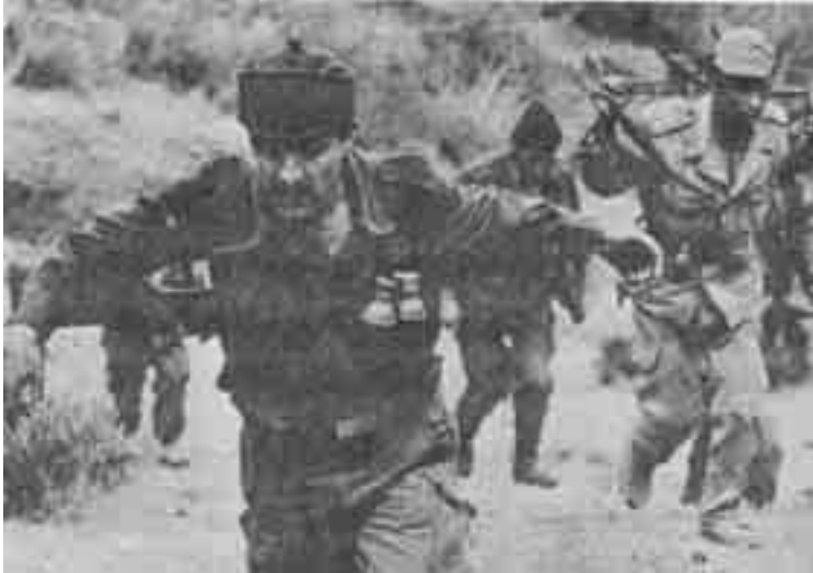
مشهد من فيلم «دورية نحو الشرق»-الجزائر