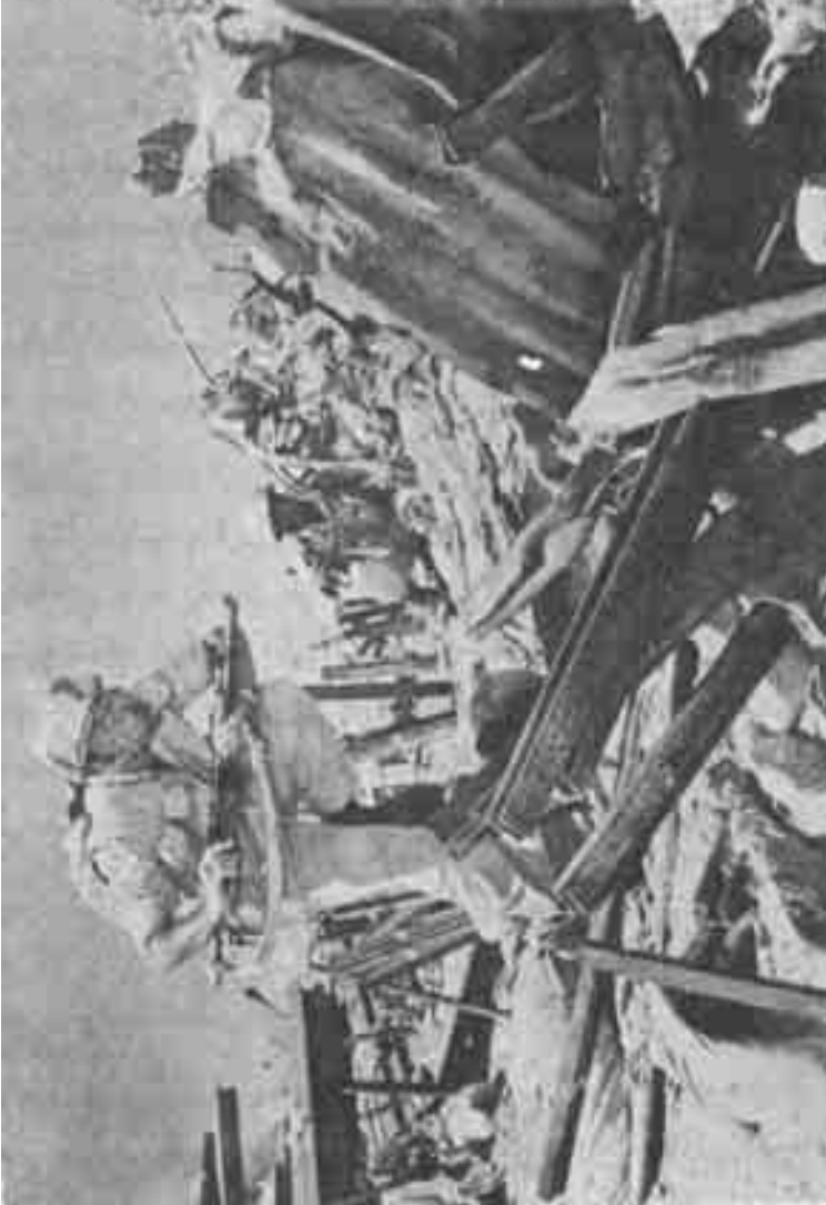
حسين فهمي في فيلم «الرصاصة لا تزال في جيبي» للمخرج حسام الدين مصطفى «مصر»