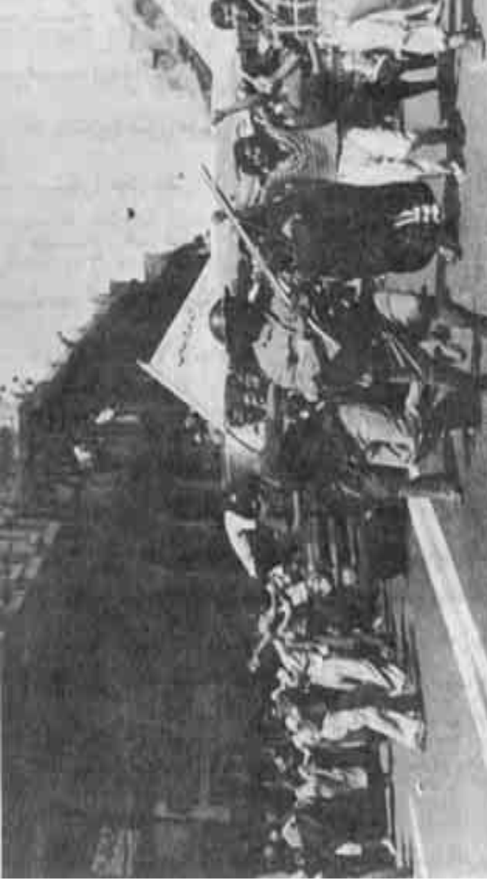
مشهد من فيلم «الأسوار» - العراق