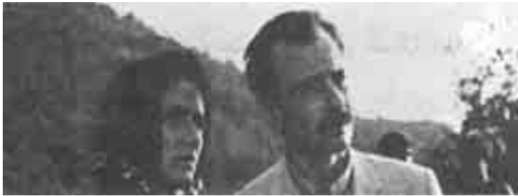
عائدا الى حيفا- قصة غسان كنفاني واخراج قاسم حول. «السينما الفلسطينية»