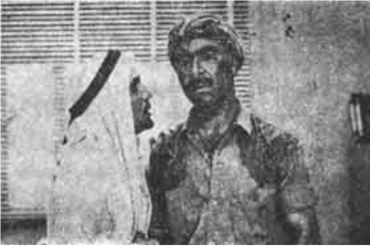
مشهد من فيلم «المخدوعون»