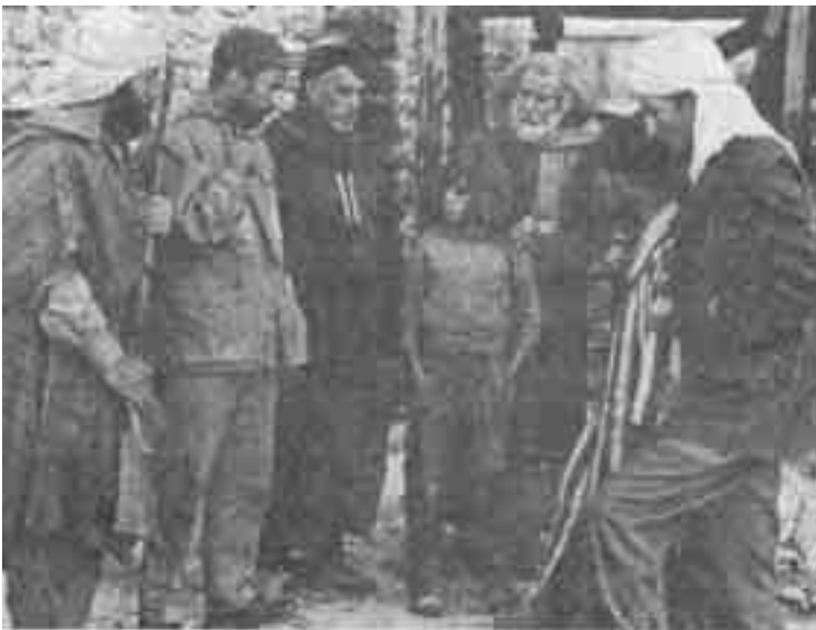
مشهد من فيلم «وقائع سنوات الجمر»-الجزائر