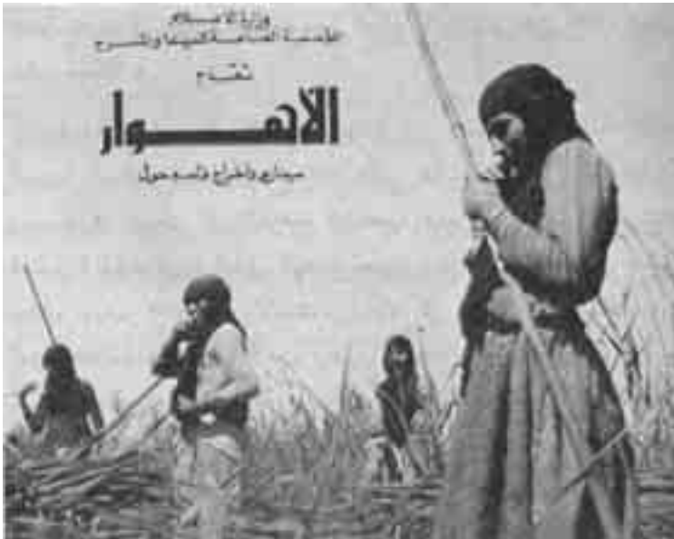
مشهد من فيلم «الأهوار» - العراق

عام 1979 فيلمه الروائي الاول (تحت سماء واحدة). والتلفزيون العراقي بدأ خطوة الانتاج السينمائي بعدد من المشاريع، بينها مسلسل (التمردون) وافلام روائية قصيرة عن السينما الفلسطينية ابرزها فيلم (انتفاضة)، ويمكن أن نقول بعد هذا العرض الشامل لمسيرة السينما في العراق إن الانتاج السينمائي فيها بدأ متأخرا، من حيث التاريخ الزمني، عشرين عاما عن بداياته في كل من مصر (1927) وسورية (1928) ولبنان (1929) اذا اعتبرنا فيلم (عليا وعصام) الذي انتج عام 1948 هو البداية، كما يمكن ان نعتبر عام 1953 بداية الانتاج المحلي المحض، إذ أن مبادرة انتاج فيلم (فتنة وحسن) شجعت عددا من السينمائيين الشبان على خوض هذه التجربة، فكانت أفلام مثل: ندم -وردة- تسواهن -عروس الفرات -من المسؤول -ارحموني-الدكتور حسن -سعيد أفندي، وغيرها، ويمكن أن نقول إن تلك الفترة أيضا لامست تباشير أعمال على طريق الجدية اتصفت بإنتاج تلك الأفلام التي يمكن أن نقول عنها إنها حاولت -إلى حد ما- تلمس الواقع الاجتماعي من خلال عرض بعض مشكلاته.